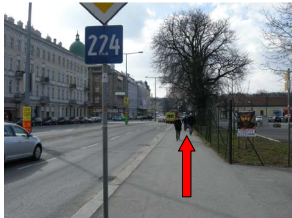
4 die Grünbergstraße entlang