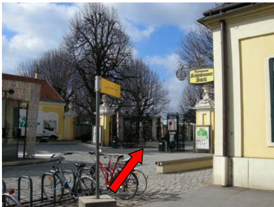
10 durch das Parktor