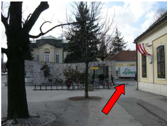
9 bis zum Eingang zum Schlosspark