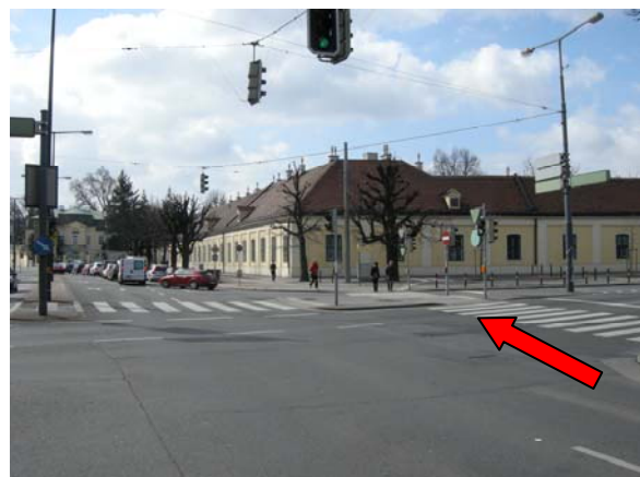
6 geradeaus über diese Kreuzung