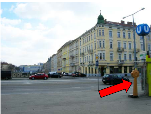
3 nach dem Ausgang nach rechts