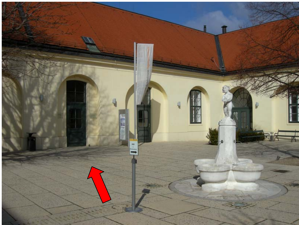
14 durch diesen Durchgang