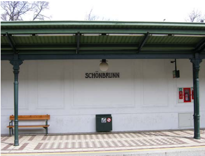
1 Mit der U4 (grüne Linie) bis Station Schönbrunn