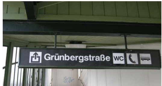
2 Ausgang „Grünbergstraße“