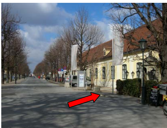
12 hinter dem Tor gleich rechts