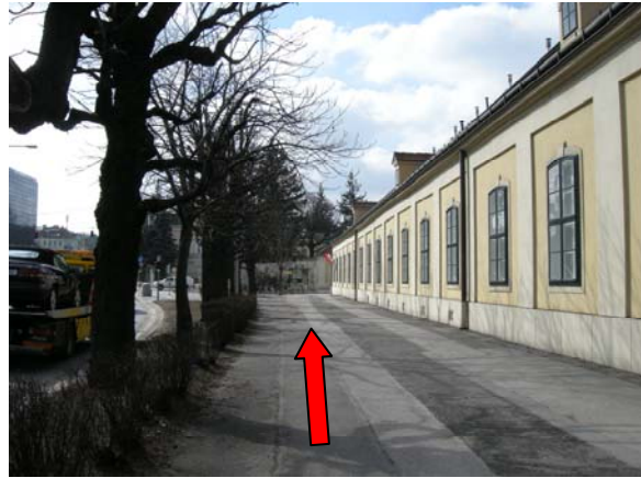
8 weiter geradeaus