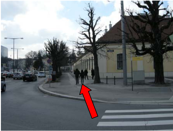
7 weiter die Grünbergstraße entlang